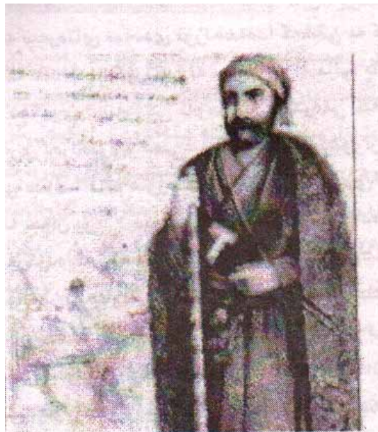
وینہ یه کی که یخه سره وی جاف وهک له گه شته ی (ریچ) دا هاتوه